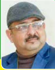
शान्तिप्रिय कार्यक्रम निर्देशक