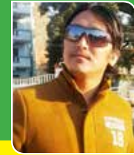
बादल थकाली सदस्य