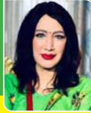
देविका बन्दना सल्लाहकार